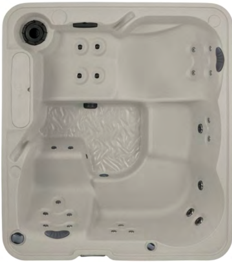
Excursion, abgebildet in Sandweiß