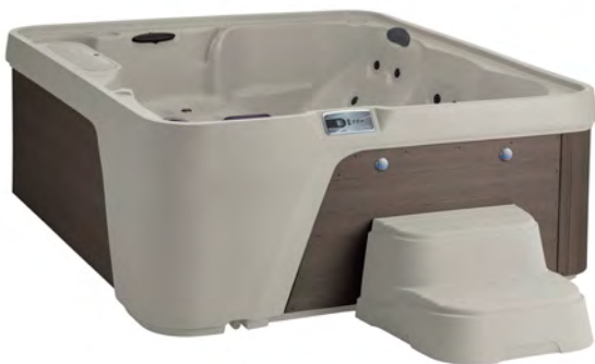
Excursion, abgebildet in Sandweiß / Braun mit eingebautem Eiskühler